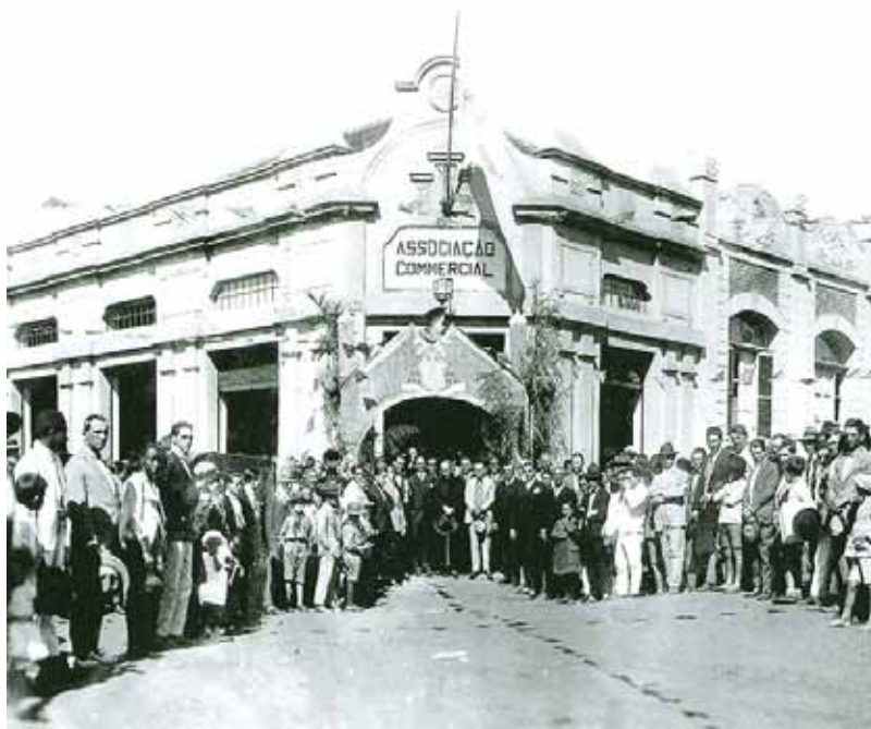
1º prédio - Fruto da união de pioneiros, a Associação Comercial foi fundada em 1927

Dia 26 de junho, a Associação Comercial e Empresarial de Presidente Prudente (Acipp) está celebrando 86 anos de sua fundação. Com suas atividades iniciadas apenas 10 anos após a emancipação territorial e administrativa de Presidente Prudente, que se deu em 14 de setembro de 1917, a entidade tem sua história intimamente ligada ao progresso da cidade.