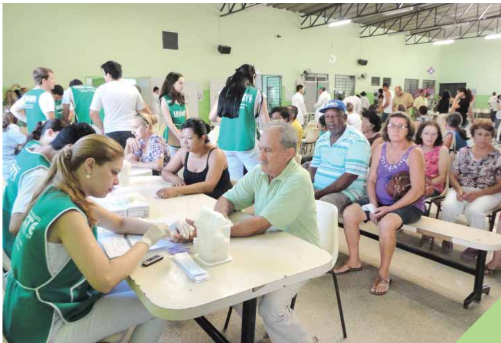
Caravana da Saúde já promoveu mais de 50 mil atendimentos

A Caravana da Saúde oferece orientações para a prevenção de doenças cardíacas, sobre câncer de próstata e de mama, realiza, além de triagem para fonoaudiologia, atendimentos de avaliação